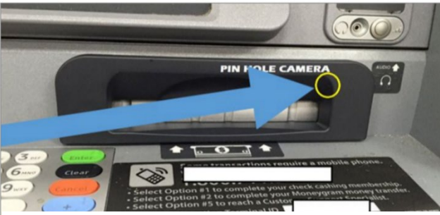
From: Cambridge PD

https://www.universalhub.com/2016/debit-card-reading-skimmer-found-cambridge-atm