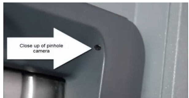
From: East Lampeter Township Police Department YouTube Video https://local21news.com/news/local/photos-how-to-detect-skimming-devices-on-atms